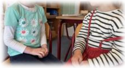
Twee kinderen tijdens de tweepraat