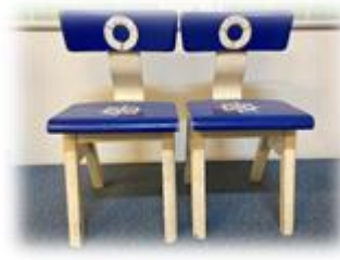
De stoelen van de hulpmatrozen

De volgende coöperatieve werkvormen komen naar voren: